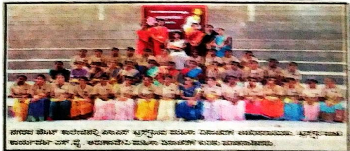
ನಾಗರ ಮಹಿಮಾ ಕಾಲೇಜಿನಲ್ಲಿ ಮಹಿಮಾ ಮಹಾ-ಠರಂಗವನ್ನು ಉದ್ಘಾಟಿಸಿದರು. ಪ್ರಕಟಣೆಯ ಕಾರ್ಯಕ್ರಮವನ್ನು ಮಹಿಮಾ ಮಹಾ-ಠರಂಗವು ಉದ್ಘಾಟಿಸಿತು.