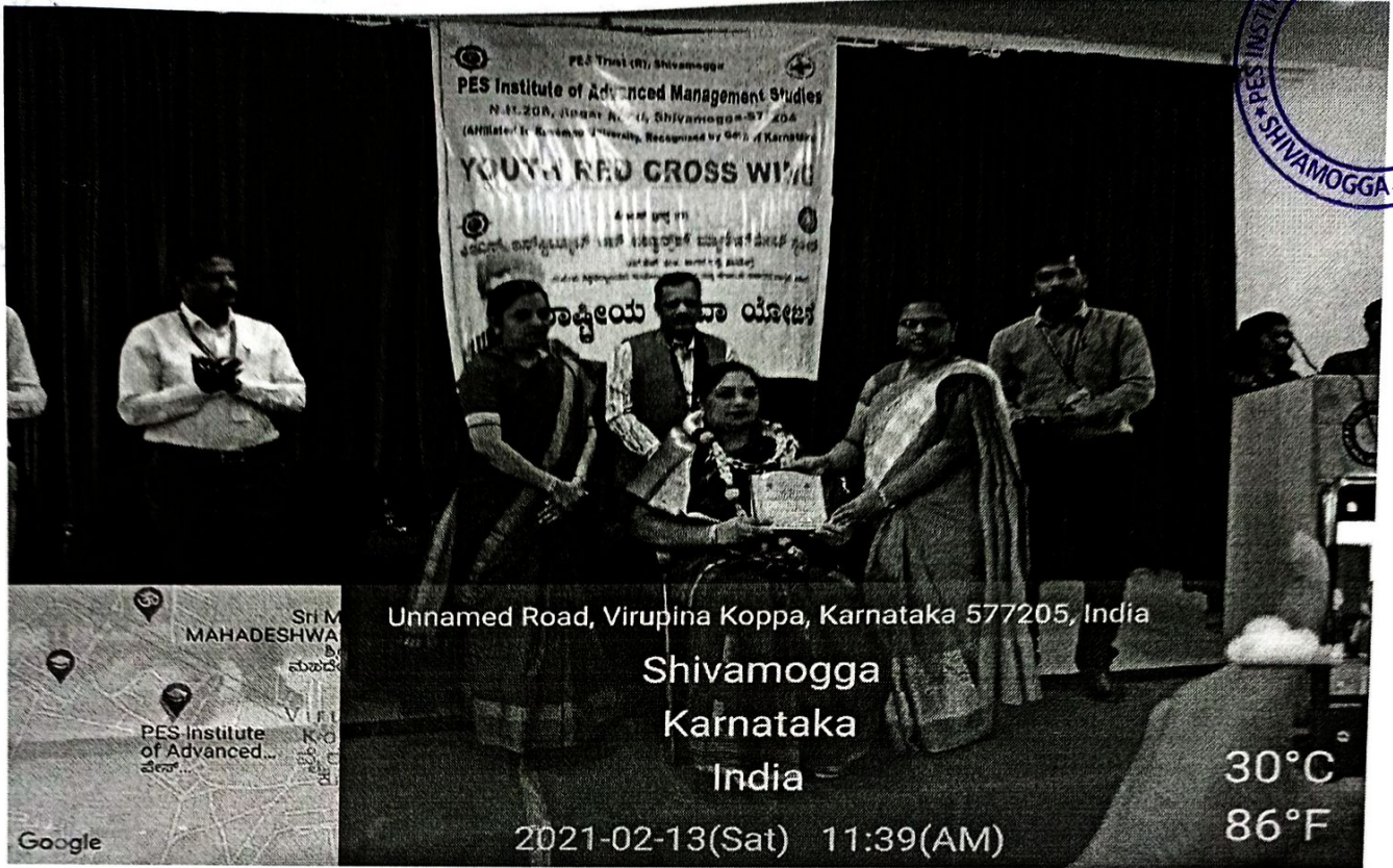
Felicitation to the Resource person