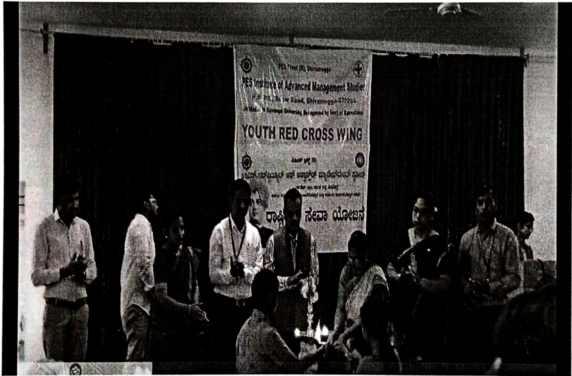
Inauguration by Dignitaries